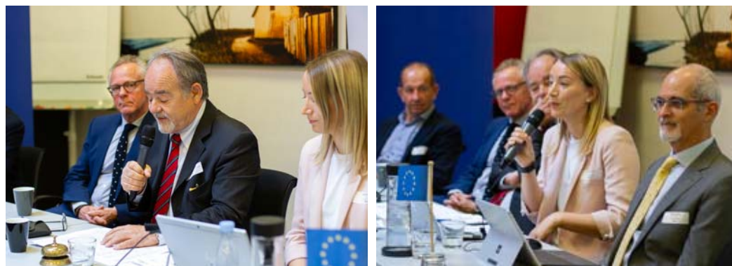
Vedení Evropské federace chovatelů ryb.

Třídenní zasedání bylo zahájeno jednáním komise pro zdraví a welfare ryb, která se zabývala přípravou pozičního dokumentu k welfare ryb, především při jejich chovu, transportu a usmrcování. Dále komise vyslechla zprávu o probíhající celoevropském projektu ParaFishControl, který se zaměřuje na výskyt parazitárních onemocnění a dostupností léčby u některých druhů ryb chovaných v Evropě. Dalšími projednávanými body komise pro zdraví a welfare ryb byla antimikrobiální rezistence včetně používání antibiotik a vakcinace u ryb v chovech a také probíhající příprava delegovaných