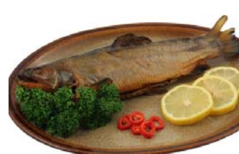
Vítězný výrobek soutěže Plzeňského kraje o značku Regionální potravina v kategorii ostatní z roku 2017 – Siven uzený s hlavou.