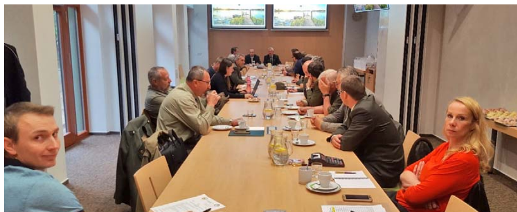
Plenární zasedání Rybářského sdružení se po pěti letech vrátilo do Brna.