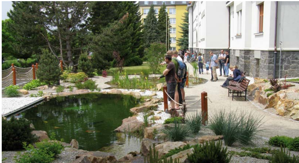
Vedle jezírka se nachází podzemní místnost s průhledem pod vodní hladinu.

Jak to vše funguje v praxi? V první řadě všechny tyto nové součásti školy navazují na výuku (kvůli tomu také byly z dotačních programů pořízeny), studenti se jejich provozu podílejí a určitě to u nich zvyšuje zájem o zvolený obor. Kromě toho škola pořádá pravidelné dny otevřených dveří a školu navštěvují zájezdy organizovaných skupin, zejména školní mládeže. Velmi se nám