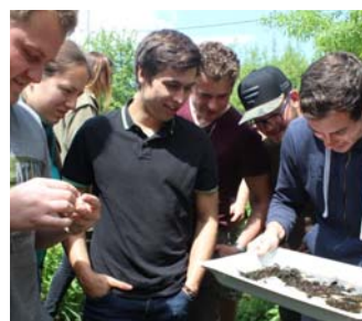
Terénní cvičení 2019

V roce 2001 byl na MZLU v Brně (po roce 1989 se z Vysoké školy zemědělské stala Mendelova zemědělská a lesnická univerzita v Brně) akreditován v rámci magisterského studia obor Rybářství a hydrobiologie, navazující na bakalářský stupeň zootechnického oboru. Původně tříletá rybářská specializace se tak musela vejít do dvouletého studia, což sebou přineslo úpravu sylabů předmětů a zkrácení doby na zpracování diplomových prací. Další změna přišla v roce 2005, kdy v rámci restrukturalizace fakulty došlo ke spojení ústavu Rybářství a hydrobiologie s ústavem Zoologie a včelařství, ze samostatného ústavu se stalo oddělení. I univerzity změnila název (v roce 2010) - z Mendelovy zemědělské a lesnické univerzity v Brně se stala Mendelova univerzita v Brně. Průlomovým rokem z hlediska rozvoje oboru Rybářství a hydrobiologie na MENDELU se stal rok 2013, kdy došlo k přestěhování obou součástí oddělení (brněnské i lednické) do nového pavilonu M. Oddělení tak získalo především rozsáhlé experimentální prostory,