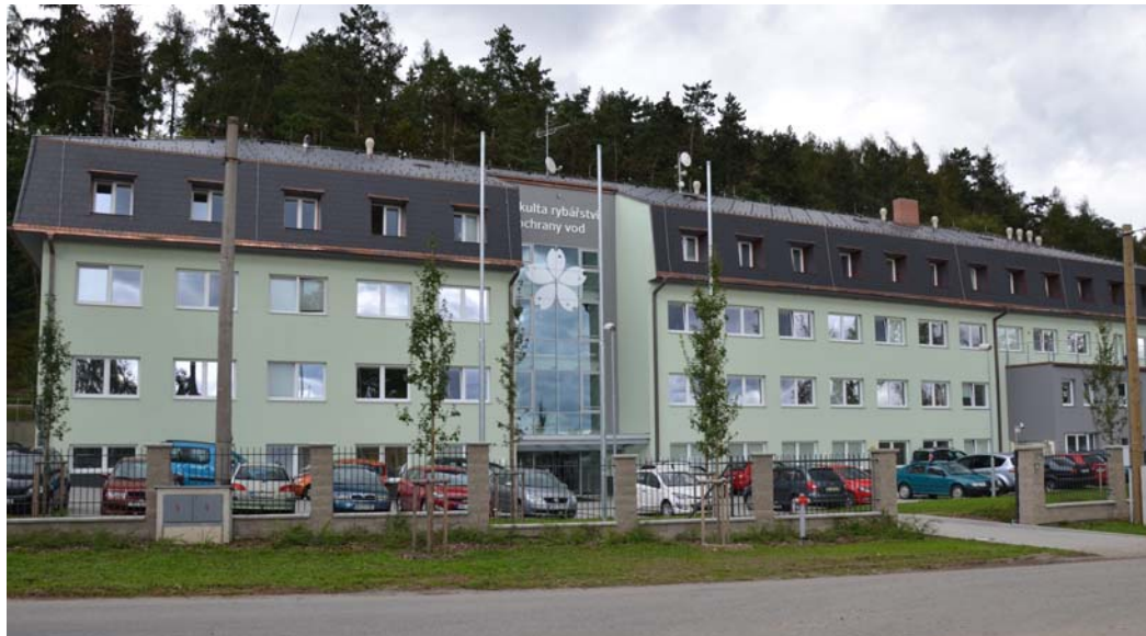
Děkanát, Výzkumný ústav rybářský a hydrobiologický (VÚRH).

Fakultě rybářství a ochrany vod se podařilo během deseti let vybudovat špičkové zázemí v Českých Budějovicích, Vodňanech