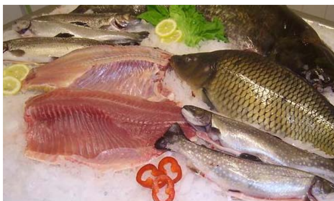
Nejprodávanejší druhy ryb: Pstruh duhový, kapr obecný, siven americký.