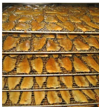
Uzené pstruží filety.