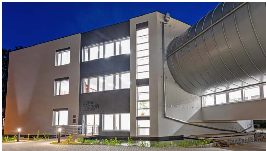
Nová budova školy „Na Ostrově“.