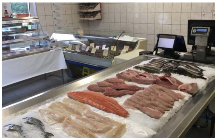
Podniková prodejna ryb se nachází přímo v areálu Zpracovny ryb Klatovy a.s. na adrese Říční lázně 423, 339 01 Klatovy.

V současnosti prodej zpracovaných ryb a rybích výrobků spíše stagnuje. Do budoucna bude nutné nabídnout zákazníkům ryby s vyšším stupněm zpracování a nové výrobky určené k přímé spotřebě nebo jen k jednoduché kuchyňské přípravě. Zavádění nových výrobků na trh však bude velmi problematické vzhledem k obchodní politice velkých nadnárodních obchodních řetězců.