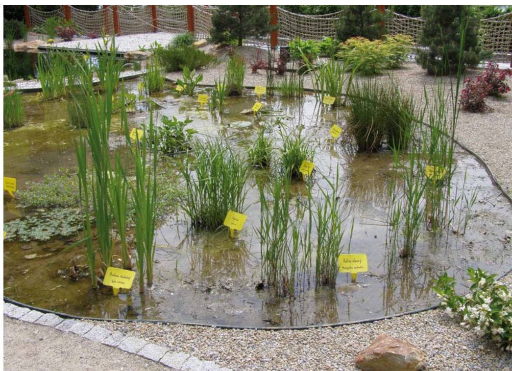
Vodní rostliny v mokřadním biotopu, který je součástí nového okrasného jezírka.

ní turistické sezoně chybí významnější turistický cíl. Věříme však, že naše aktivity jsou přínosné i pro popularizaci našeho oboru, který to určitě potřebuje. To, že je u nás nyní o dost více práce, že řešíme například problémy s vyšší spotřebou energií a že ani o prázdninách není u nás klid, vyvažují kladné ohlasy návštěvníků