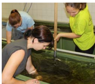
Práce v akvariální místnosti