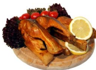
Vítězný výrobek soutěže Plzeňského kraje o značku Regionální potravina v kategorii ostatní z roku 2016 – Tolstolobik uzený porcovaný.