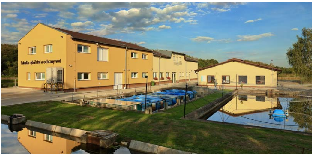
Genetické rybářské centrum.

Za deset let své existence ušla Fakulta rybářství a ochrany vod díky svému vedení i ostatním zaměstnancům velký kus cesty. Nezbyvá než popřát, aby se jim i jejich studentům a absolventům i nadále dařilo se ctí obstat na vědeckém poli mezinárodním, ale také významným podílem přispívat ke zlepšování „stavu vody na českých tocích“.