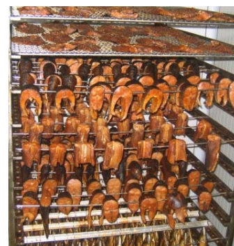
Uzené ryby ve zchlazovací komoře.