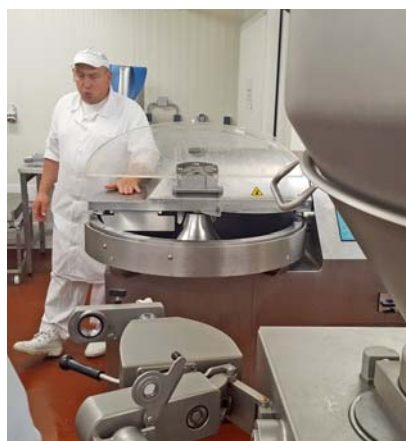
Firma disponuje moderní zpracovnou s vlastním vývojem nových výrobků.